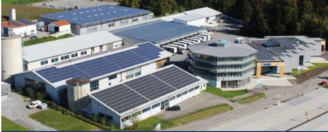
ZENTRALE RÖHRNBACH in BAYERN